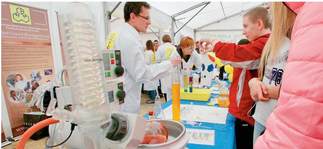
FOT. GRZEGORZ GALASINSKI